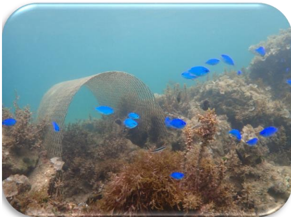
ルリスズメダイの群れ