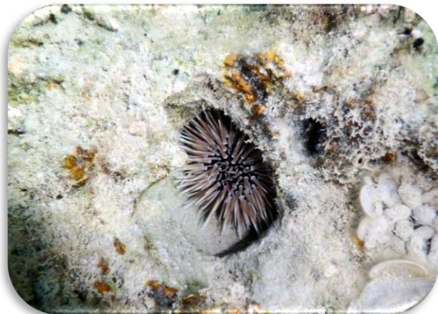
リュウキュウナガウニ(沖縄どこでもいる)