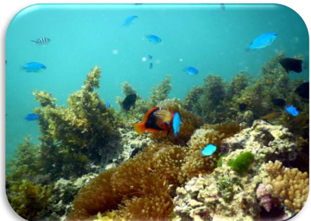
ルリスズメダイ、ハマクマノミ、クロスズメダイなど