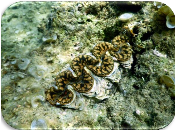
シヤコガイ(シラナミ)